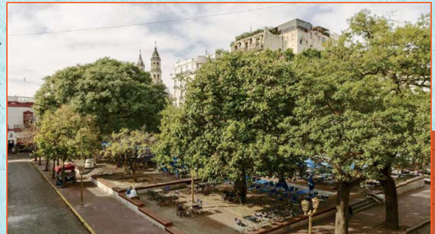
Aquí estaba en 1810 la antigua PLAZA DE LA RESIDENCIA (hoy Plaza Dorrego), en Buenos Aires, adonde estacionaban las carretas que traían mercaderías desde el Sur.