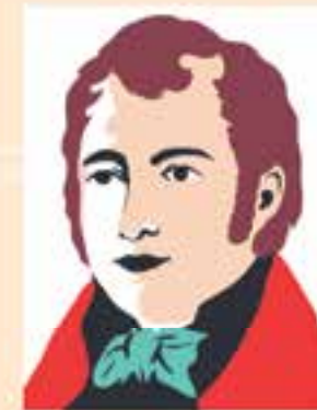
Juan José Castelli