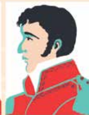
Antonio González Balcarce