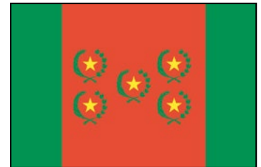
Primera bandera de Bolivia (1825-1826)

La bandera que conocemos actualmente como "La Tricolor" es el tercer diseño en la historia boliviana. La primera bandera que representó al país fue creada días después de proclamarse la Independencia en 1825, y era roja y verde. Al año siguiente, el mariscal Antonio José de Sucre, Presidente de la República, decretó un cambio en el símbolo patrio y agregó el amarillo, fijando los tres colores que conocemos actualmente. En 1851 el entonces presidente