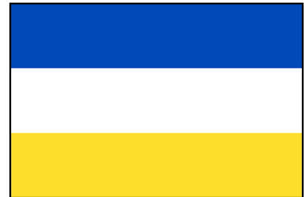
Bandera de 1812

Chile tuvo dos banderas distintas antes de llegar a la tercera, que es la actual. En el año 1812 el territorio chileno seguía bajo el régimen de la corona española y José Miguel Carrera creó el primer símbolo patrio, tras una victoria contra el ejército realista. La bandera contenía tres franjas: una amarilla, una blanca y una azul. En el año 1817 se cambiaron los colores por el azul, el blanco y el rojo.