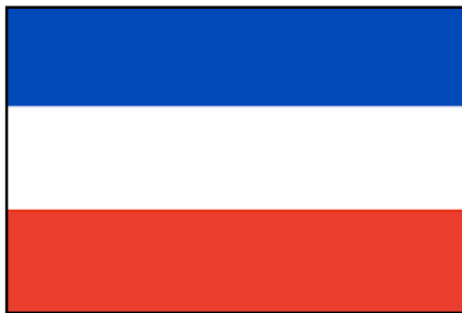
Bandera de 1817

Meses después se modificó el diseño, manteniendo los mismos colores.