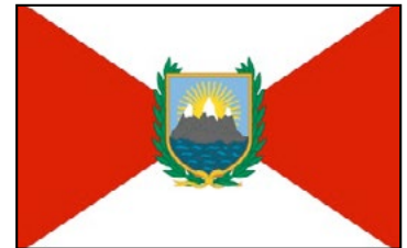
Bandera creada por San Martín