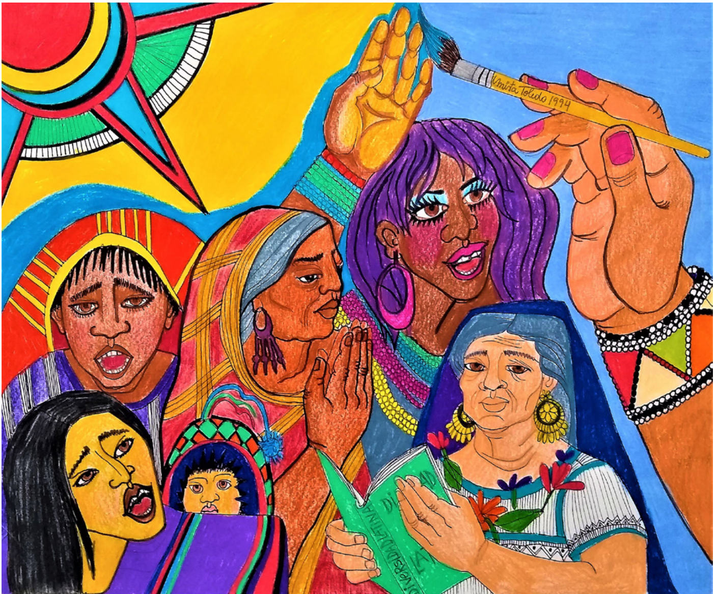
Latin Americans, 1994 [Pure Diversity Series].

Esta pintura de Mirta Toledo forma parte de una serie que se llama “Diversidad pura”. La pintura permite seguir varios recorridos y lecturas: a través de los personajes, las formas, los colores, las texturas, y los objetos. Nos detendremos en uno en particular: El LIBRO. Si bien sabemos que la pintura forma parte de una serie, no tenemos referencias que indiquen en qué ciudad o país específicamente transcurre esta escena. Es ahí donde la imagen del libro contextualiza la obra.