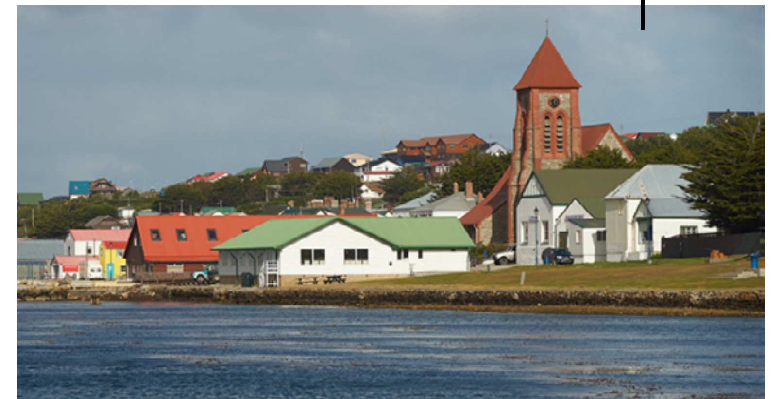
Puerto Argentino, capital de las islas