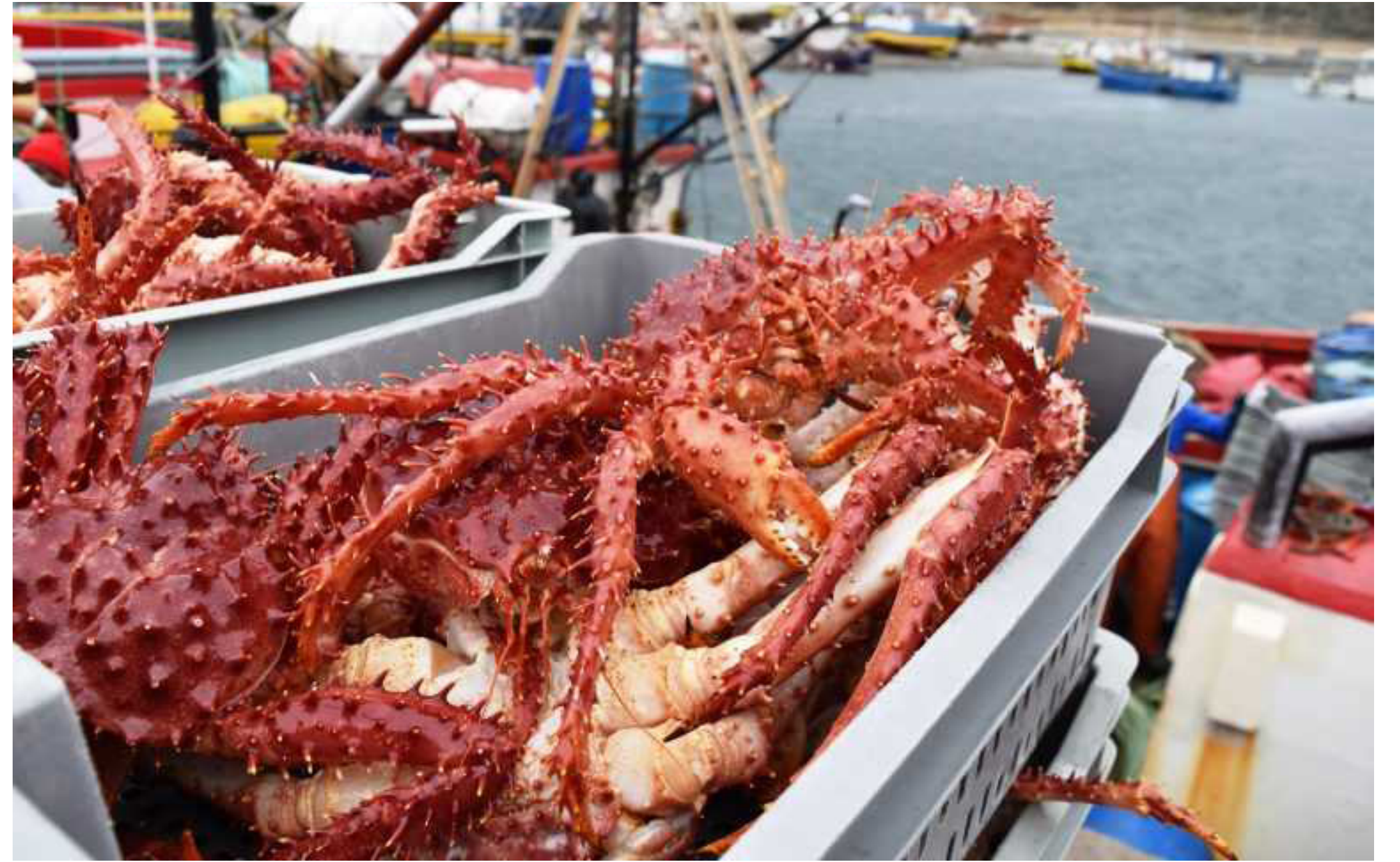
Pesca de centollas

Las islas también se encuentran rodeadas por cuatro cuencas marinas con potenciales recursos hidrocarburíferos de nivel comercial. Y la explotación de ganado ovino ocupa un lugar destacado entre sus actividades económicas.