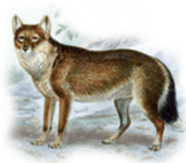
Texto adaptado de https://www.argentina.gob.ar/noticias/malvinas-una-mirada-sobre-nuestro-patrimonio-natural-presente-en-las-islas

El zorro Malvinero es el único mamífero terrestre nativo isleño y el primero de nuestra fauna autóctona en ser extinguido por la actividad humana. Su registro de existencia data del periodo glacial, en el que los mares de todo el mundo descendieron unos 130 metros haciendo más accesibles las islas para la fauna del continente. Con el paso de los milenios el clima más cálido derritió gran parte de los hielos continentales aumentando nuevamente el nivel del mar de manera progresiva. Se cree que el zorro malvinero se alimentaba de huevos de pingüinos, mariscos, crías de lobos marinos y focas. Para protegerse del frío cavaba guaridas entre los pastizales densos. Su aspecto fue semejante, en forma y coloración, al del zorro colorado patagónico. A partir de recientes estudios genéticos se llegó a la conclusión de que su pariente vivo más cercano es el aguará guazú. El zorro malvinero se extinguió hacia fines del siglo XIX [1876], cuando se cazaron los últimos ejemplares de esta especie.