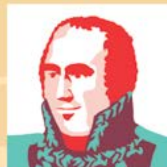
Miguel de Azcuénaga: Fue regidor.