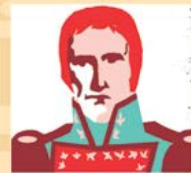
Cornelio Saavedra: Regidor de 1801 a 1805.