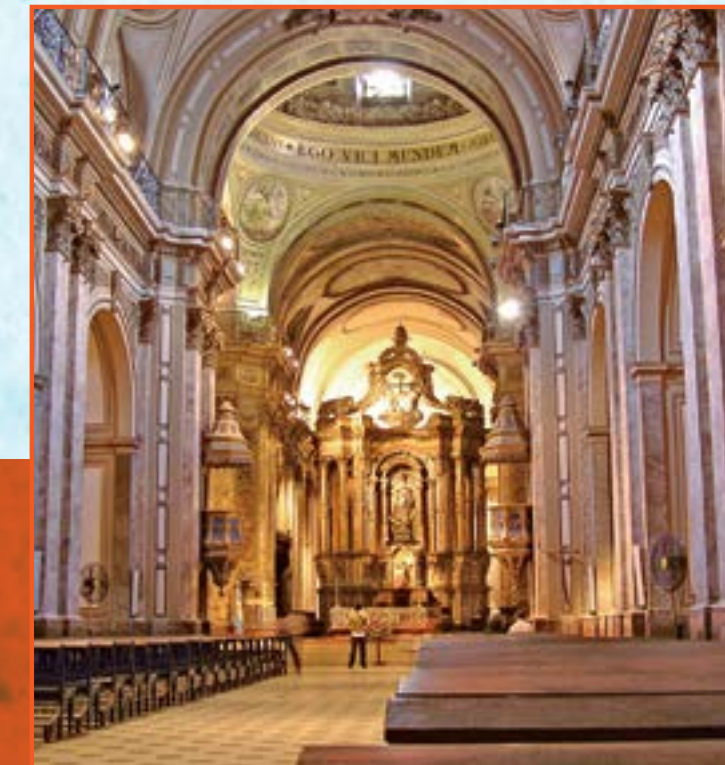
INTERIOR de la Catedral, que nació como una humilde choza de paja. Su nave central tiene casi 100 metros de largo, y la cúpula alcanza los 41 metros de altura.