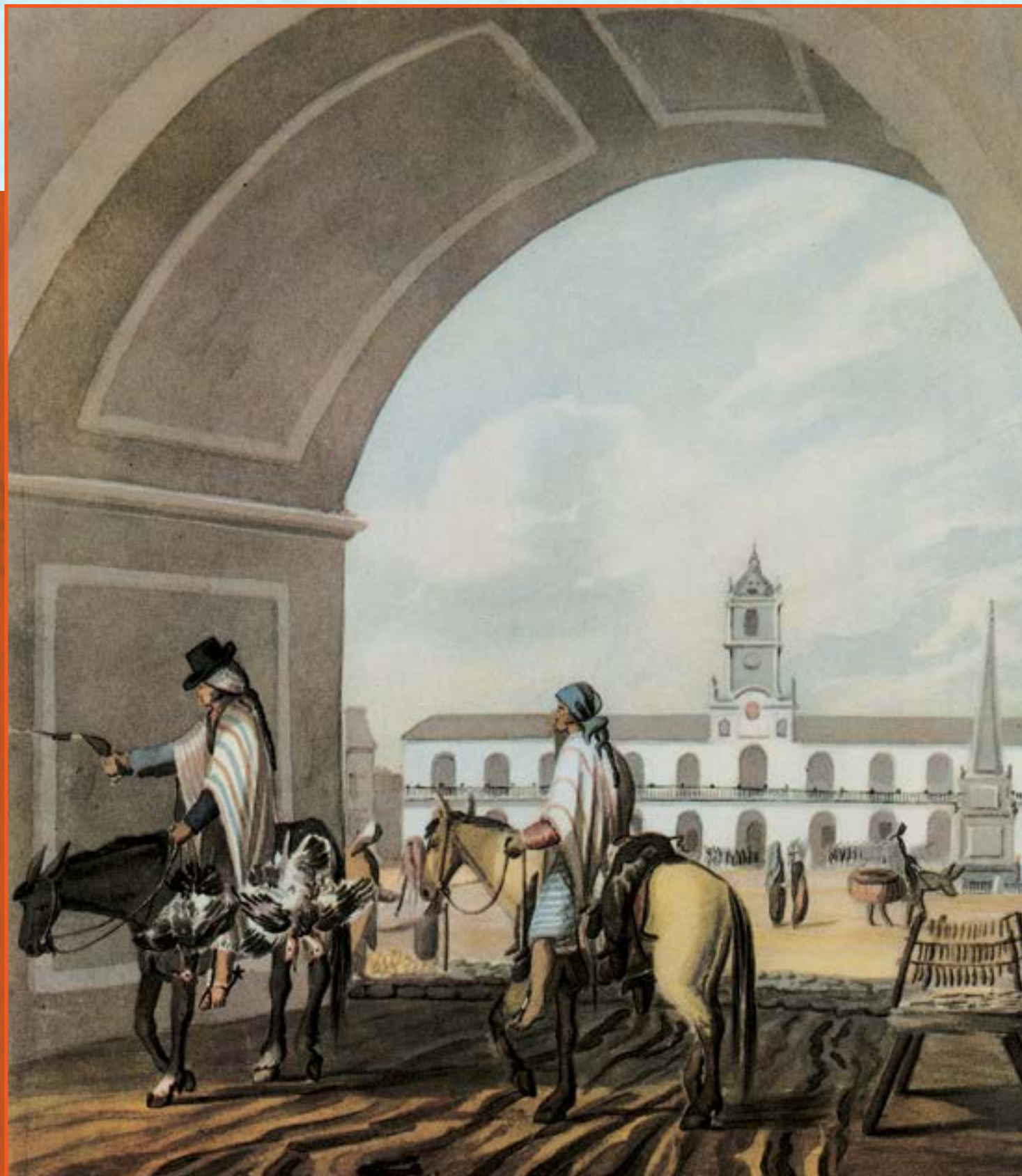
El cuadro es de 1817 y el autor es EMERIC ESSEX VIDAL (1791-1861), un marino inglés aficionado a la pintura. Es un valioso testimonio del Buenos Aires de entonces.