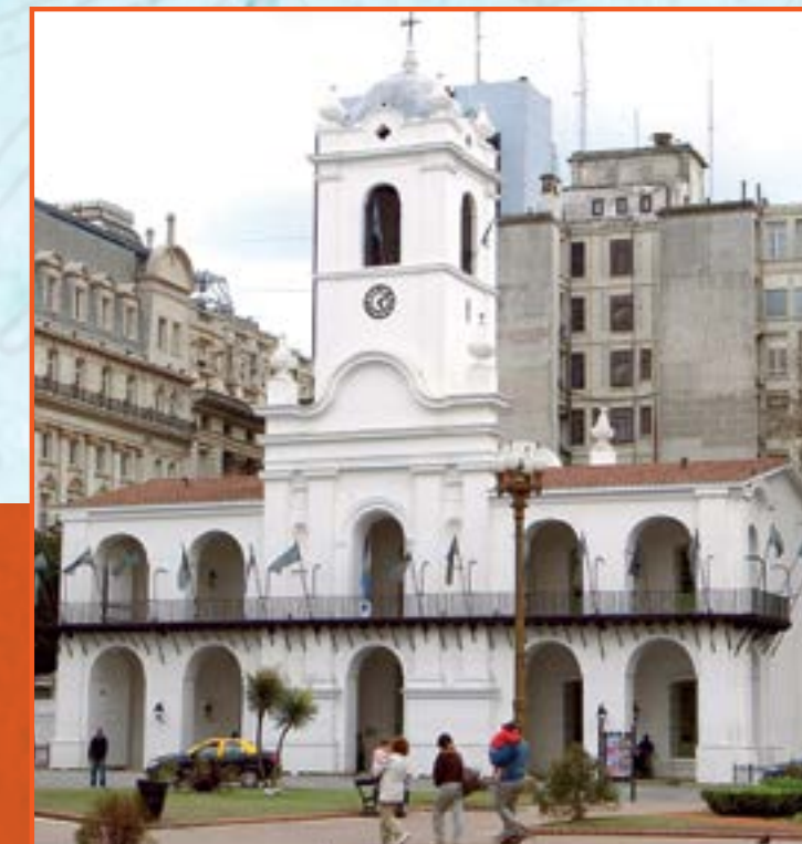
MUSEO HISTÓRICO NACIONAL DEL CABILDO Y DE LA REVOLUCIÓN de Mayo, donde no solo verás el edificio, sino muebles y otros elementos de la época.