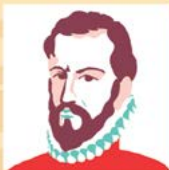
Hernandarias: Ordenó su construcción.