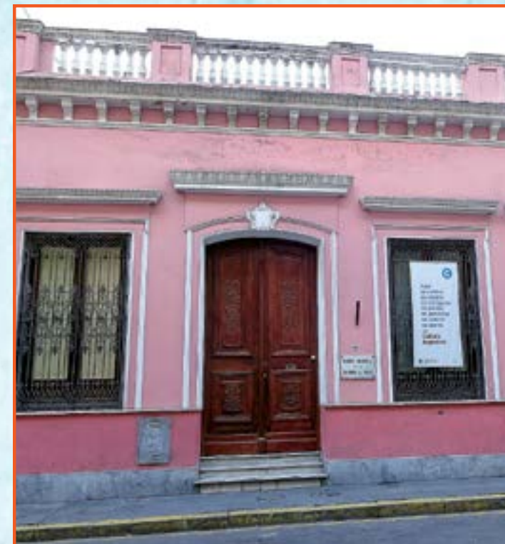
La vestimenta de los hombres y mujeres que vivieron en Buenos Aires en mayo de 1810. Los podés ver en el MUSEO NACIONAL DE LA HISTORIA DEL TRAJE , Chile 832.