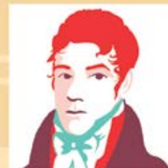
Martín de Álzaga: Fue alcalde entre 1795 y 1796.