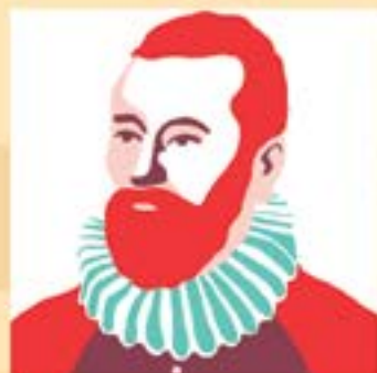
Juan de Garay: Asignó el actual solar el Cabildo.