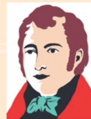
Juan José Castelli