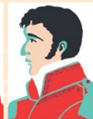
Antonio González Balcarce