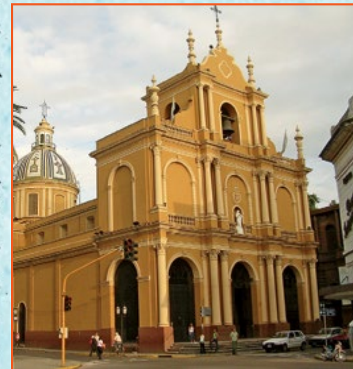
BASÍLICA DE SAN FRANCISCO, en San Miguel de Tucumán. Se encuentra ubicada en la esquina de San Martín y 25 de Mayo. En su interior se guarda la mesa donde se firmó el acta de la Independencia.