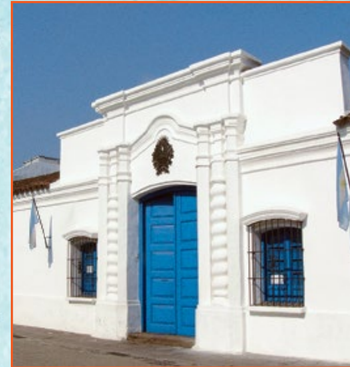
CASA DE TUCUMÁN. Hoy es un museo. La dirección es Congreso 151, San Miguel de Tucumán. Fue reconstruida en el siglo XX. La sala donde se realizó la jura de la Independencia es el recinto original.