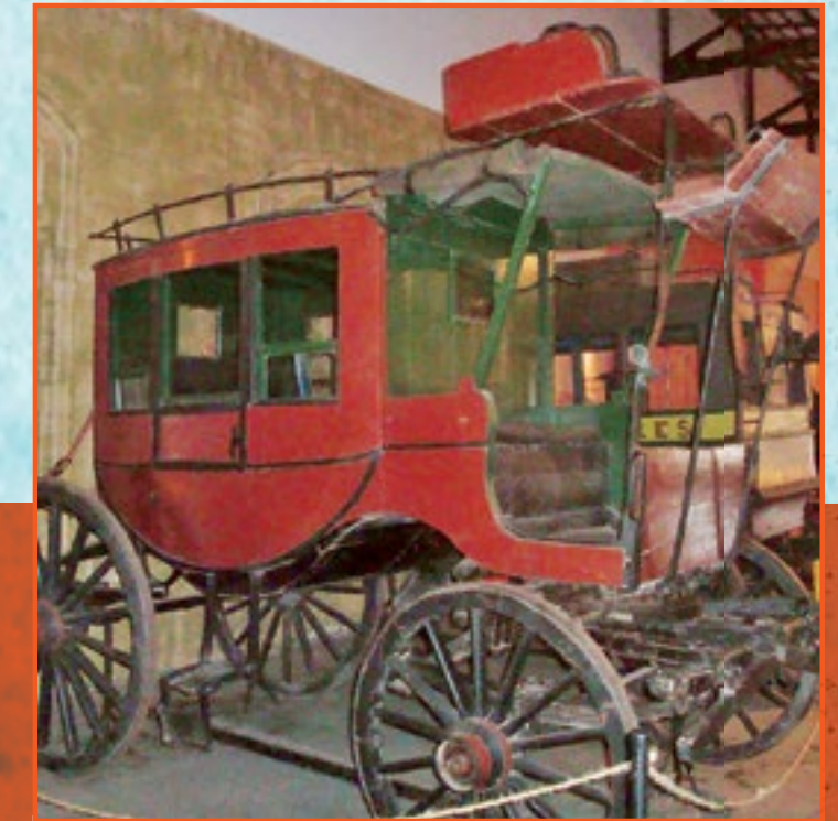
GALERAS Y CARRETAS DE LA ÉPOCA DE LA INDEPENDENCIA. En el Complejo Museográfico Provincial Enrique Udaondo, Lezica y Torrezuri 917, Luján, provincia de Buenos Aires