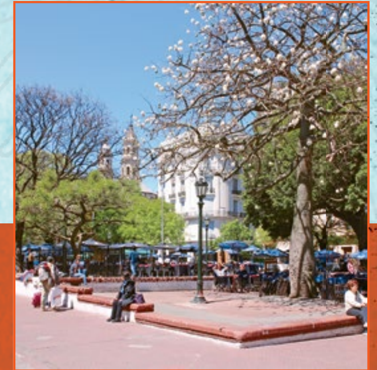
PLAZA DORREGO. Antes llamada Plaza de la Residencia, fue uno de los cuatro lugares de la ciudad de Buenos Aires en donde el pueblo adhirió, en 1816, a la Declaración de la Independencia.