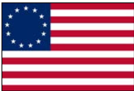
Primera bandera de Estados Unidos (1777)

El territorio de los actuales Estados Unidos fue una colonia británica hasta que declaró su independencia el 4 de julio de 1776. En aquel entonces no existía una bandera oficial, pese a que usaron durante la Guerra de la Independencia una llamada "bandera americana", pero que era de carácter no-oficial. Meses después de la independencia decidieron tener su símbolo patrio.