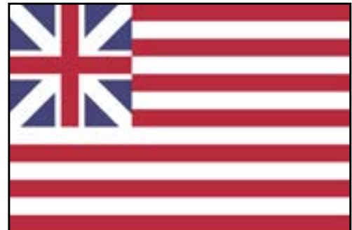
Primera bandera no oficial de Estados Unidos (usada en la Guerra de independencia)

blanco y rojo en representación de cada uno de los estado que conformaban la nación. A medida que fue pasando el tiempo, se fueron incorporando nuevos estados, por lo que se agregaron a la bandera más estrellas, siendo la última lanúmero cincuenta en representación de Hawaii, en 1960.