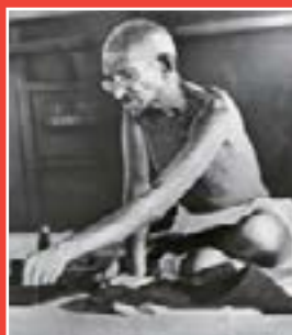
Fue un gran defensor del vegetarianismo y rechazaba cualquier forma de maltrato a los animales.

L a India no era a mediados del siglo pasado el país que es hoy, una nación soberana donde solo los indios deciden su destino. Nada de eso: era una colonia, un dominio británico gobernado por un delegado de la reina. ¿Te imaginás sentirte extranjero en tu propio país? ¿Ser discriminado por haber nacido indio? Seguramente sufrirías mucho. Y eso es lo que les pasaba a los indios y a uno en particular, al abogado Mahatma Gandhi (1869-1948), quien desde joven hizo todo lo posible para cambiar esa situación. Lo diferente en Gandhi es el camino que tomó para luchar por la independencia de la India: el de la no violencia. No hacía sino aplicar un concepto (la ahimsa , en sánscrito, la lengua clásica de la India) que sostuvieron siempre las más antiguas tradiciones religiosas y culturales de aquella nación. Gandhi decía que la no violencia es común a todas las religiones, incluyendo al cristianismo y al islamismo. Lo notable es que su acción y su palabra fue seguida por todo un pueblo y, a la postre, terminó consiguiendo el objetivo que se había propuesto.