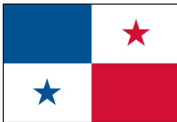
Primera versión de la bandera panameña

era casi igual a la actual, pero los cuadrantes tenían otro orden. Antes de ser aprobada, el diseño cambió y los cuadrantes se ordenaron de la manera actual. La Asamblea Nacional la adoptó junto al escudo mediante la Ley 64, en 1904.