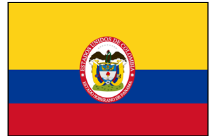
Bandera del Departamento de Panamá

La bandera actual de Panamá fue diseñada por Manuel E. Amador Terreros. La primera versión