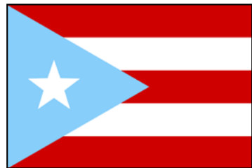
Primera bandera de Puerto Rico (1895)

En 1895, se la hizo por primera vez en el Chinney Corner Hall de Nueva York. Esa primera versión de la bandera usaba un color azul claro dentro del triángulo. La bandera fue adoptada oficialmente por el Gobierno de Puerto Rico en 1952, con un color azul intenso.