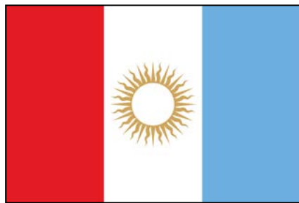
Bandera de 2010, anterior al cambio de colores.